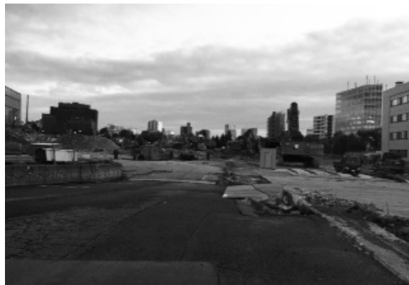
多くの批判や反対の声を背に、国立競技場の解体工事を強行

都が「緑化計画」もなのまま「風致地区」の樹木の伐採の許可を出していたことを示して「何のための環境アセスかと言わざるを得ない。環境優