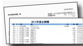
▲インターネットで自主公開している帳簿(2015年度分)

共産党都議団は政務活動費が、条例によって支給されるようになった2001年から、領収書添付を義務付ける修正案を何度も提出。2006年には、自主的に会計帳簿をインターネットで公開しました。こうした結果、2008年ついに実現しました。