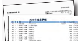
▲インターネットで自主公開している帳簿(2015年度分)

共産党都議団は政務活動費が、条例によって支給されるようになった2001年から、領収書添付を義務付ける修正案を何度も提出。2006年には、自主的に会計帳簿をインターネットで公開しました。こうした結果、2008年ついに実現しました。